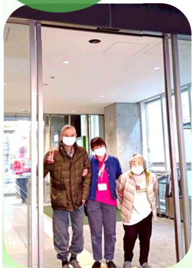
府中市役所新庁舎