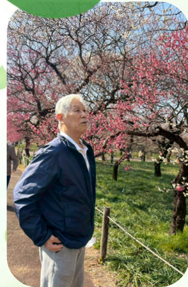
梅まつり（郷土の森）