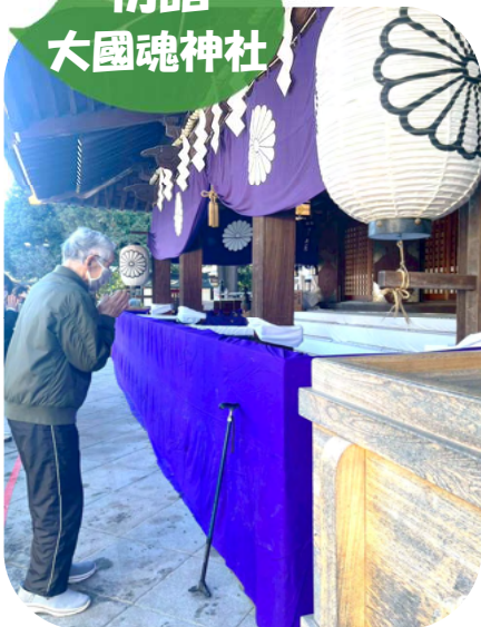
新年の空気を感じながら初詣へ