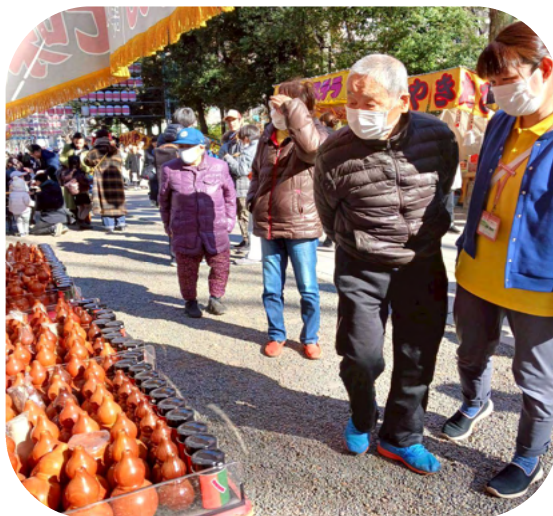
屋台の賑やかな雰囲気も楽しみました