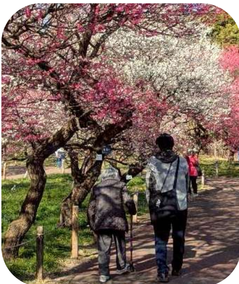
梅の種類にも注目しながら楽しみました