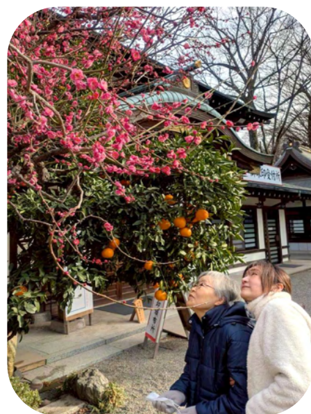
早咲きの梅に頬がほころびました