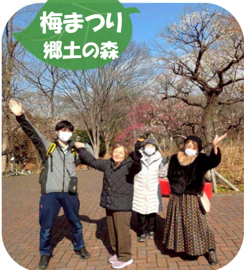
満開の梅に表情が明るくなりました