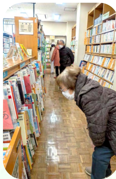
図書館（是政文化センター）