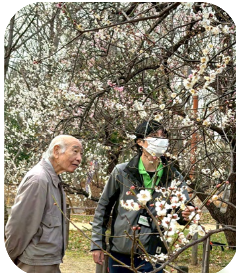
風に乗って良い香りがしました