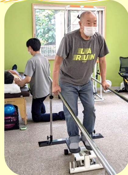
新しい運動器具 「ステッパー」が増えました。