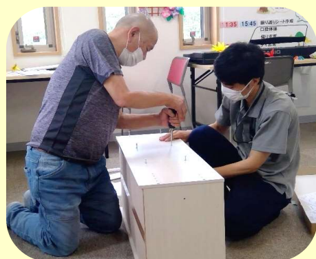
新しく設置する 棚の組み立てを 手伝っていただき ました。