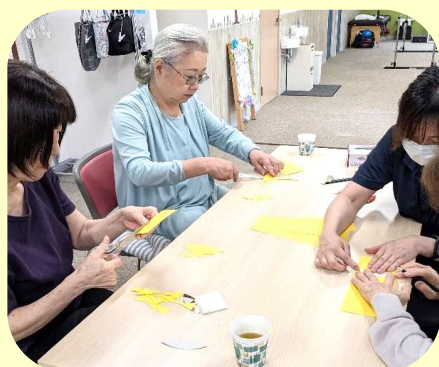
運動の合間に 季節の作り物や 手芸、ネイルなど も楽しんでいます。