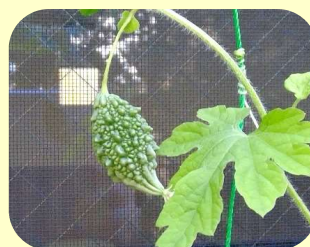
利用者さんに 植え付けていた だいたゴーヤに 実がなりました。